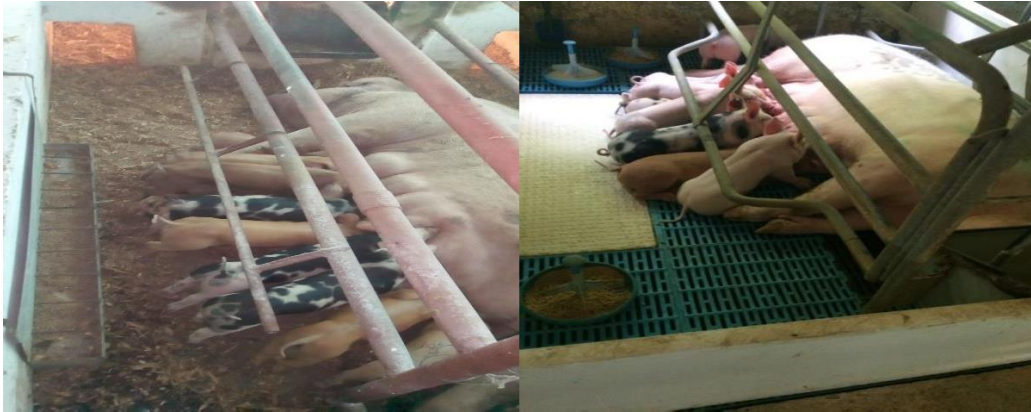
Fig. 1. Paridera tradicional.

La fase experimental se realizó en seis meses, se utilizaron 53 lechones de la raza landrace, estos fueron distribuidos en dos tratamientos: To: paridera o jaula tradicional (confinamiento), Figura 1, y T1: paridera o jaula tecnificada, Figura 2.